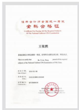
专业阶段全科合格证书